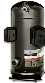
Copeland Scroll Digital

Disponible en 2-5 HP, monofásico y trifásico