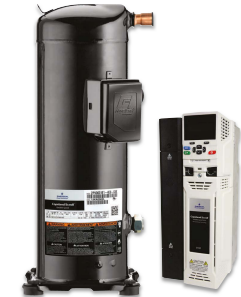
Copeland Scroll Velocidad Variable - Comercial