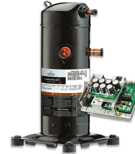
Copeland Scroll Velocidad Variable - Residencial