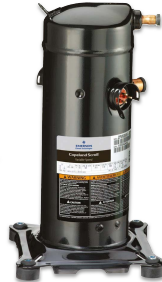
Última generación Copeland Scroll UltraTech