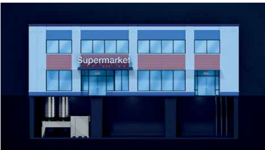
installazione monoblocco interno