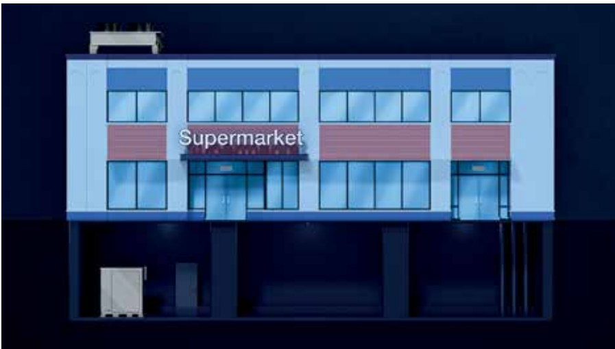
installazione split interno/esterno